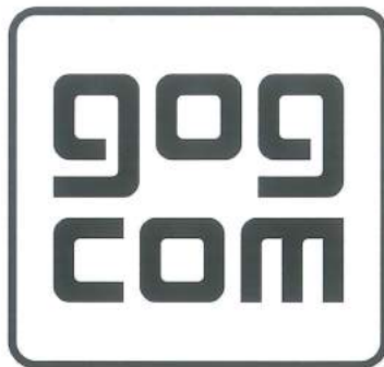
Aktuelles Logo der Website

Doch auch in anderen Punkten zeigt gog.com seine Vorteile gegenüber Steam. So kann man zum Beispiel nicht heruntergeladene Spiele auch nach beliebig langer Zeit gegen die Rückerstattung des kompletten Preises zurückgeben, heruntergeladene immerhin 30 Tage lang, falls technische Probleme